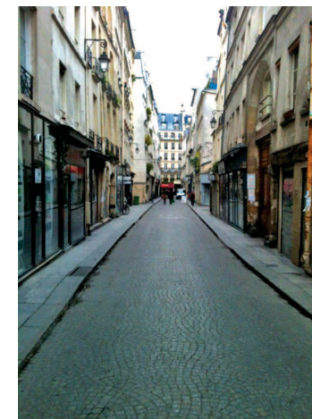
Rue alentour et ses façades faubouriennes typiques du centre de Paris