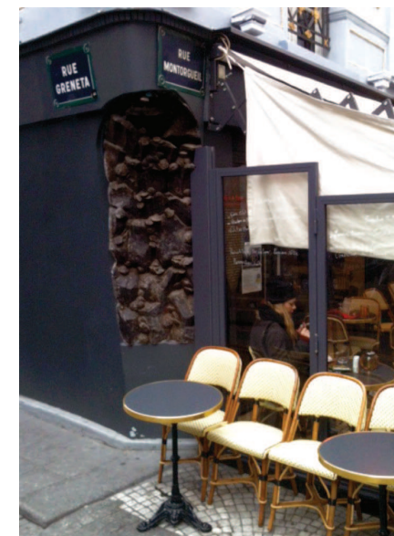
Vue sur la typologie urbaine de la situation de l'appartement