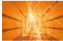
TABLE RONDE CLIMATE WEEK, MARDI 27 MARS À 19H00

Logement, mobilité, une double précarité énergétique ?